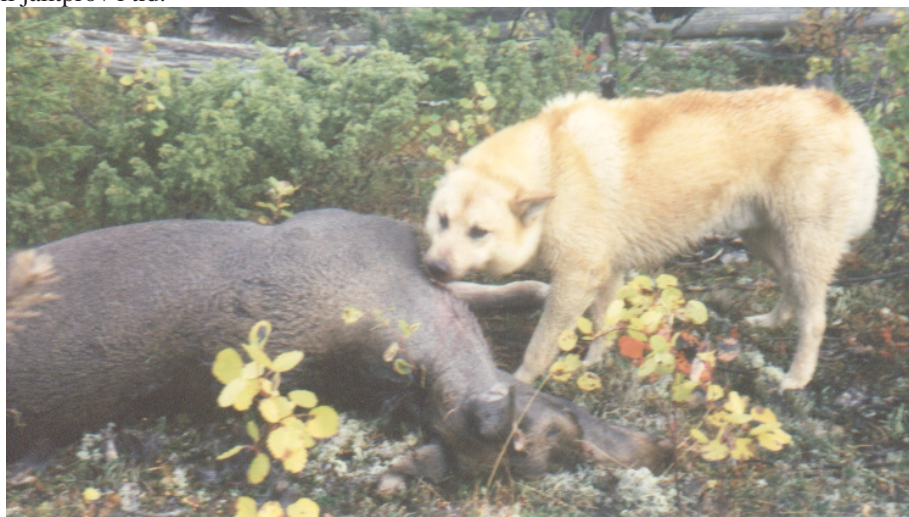
Benny Salomonssons hund Vitas luggar en fälld älg vid mitten av 80-talet

Observera att anmälingstiden oftast löper ut i november så det gäller att anmäla sin hund till jaktprov i tid.