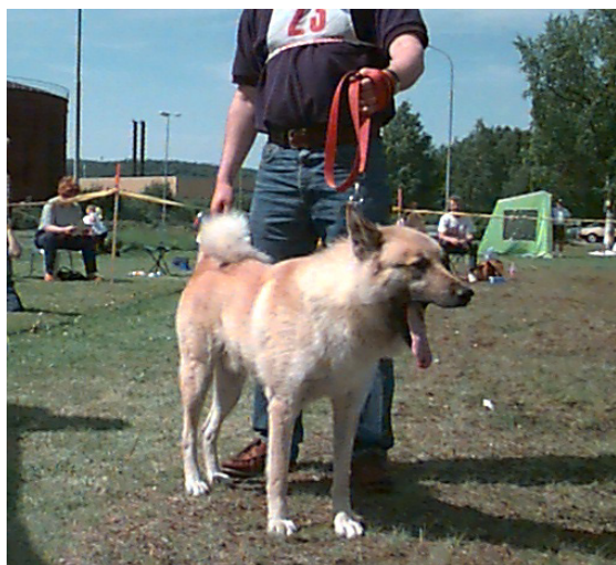
Hunden Brum född -94 vilken blev bästa hund i Hällefors verkar ta det med ro. Äg K-E Svanberg