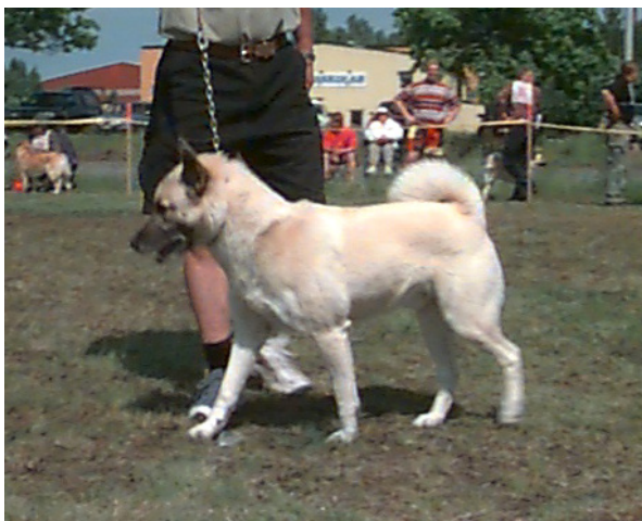
I strama tyglar visas Nalle upp, Nalle född -94 Äg: Wåge Lundgren