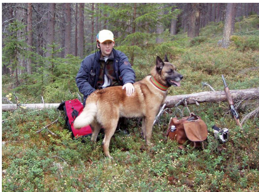
Atlas och Tommy

Snabbt började han leta efter en tjärstomme att elda upp. Under letandet hör vi ett plask på andra sidan sjön. I strandkanten kom en stor älgdjur sakta gående. Mellan varven stan-