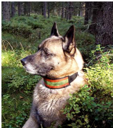
Atlas i bärriset