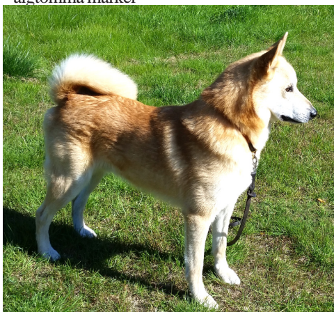
Tjäderfjäders Astok AS56775/2012

Ut 05.00 hunden söker i turer om 5-15 min i mycket bra tempo. Incall sök u,a. För dagen älgtomma marker