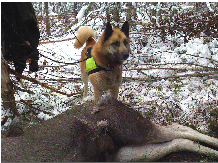
Decko med kalv efter fint ståndarbete. (Ronja är hans mormor)