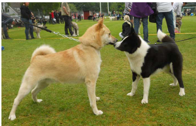
Bössholmens Taigo flörtar med en Karelardam

Det går naturligtvis inte att dra några slutsatser på två säsonger och så få prov, men det är ändå en notering. Förklaringen kan vara enkel, jag vet nämligen att flera lokalklubbar har reflekterat över det ovanligt stora antalet nollprov och spekulerat över att det är den minskande älgstammen som nu börjar visa sig även i jaktprovresultaten.