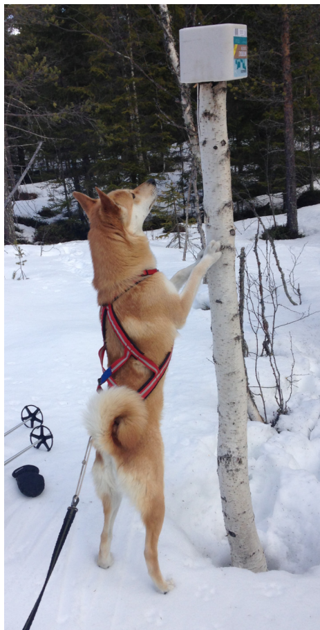
Sävliðens Jiri, se föregående sida

J RÄVAMYRENS FELICIAAS20595/2012 Pris:000 Poäng:33