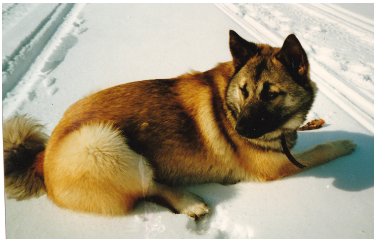
Ronja i snön, 7 månader gammal

Jag går fram till skottplatsen, den är helt nedtrampad.