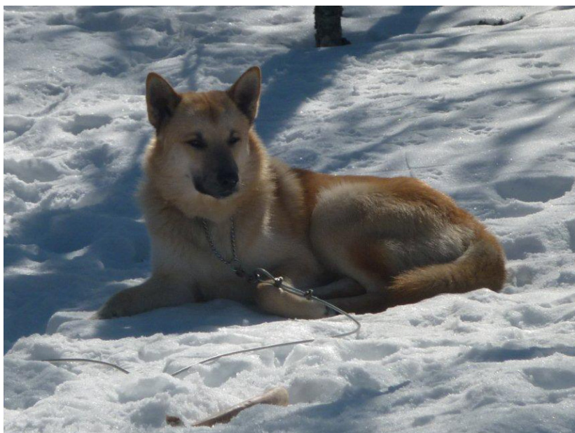
Njuter av solen i snön