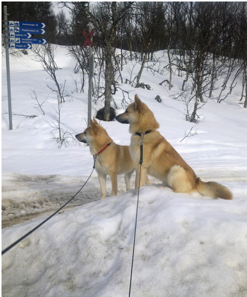
Skidtur i blötsnö, kan det va nått?

Till stugan kom vi efter SÄK:s årsstämma i Söråker norr om Sundsvall, där vi haft några givande dagar med diskussioner och samvaro med likasinnade. På fredagen genomfördes en ordförandekonferens där remissvaren på jaktprovsreglerna redovisades. Tyvärr hade inte Hälleforshundklubben lämnat något svar beroende på att alltför få kommit med synpunkter på regelverket. Förhoppningsvis blir vi bättre i nästa remissrunda. Lokalklubbarna hade dock lämnat fylliga svar och nu skall jaktprovskommittén jobba vidare med inkomna synpunkter fram till nästa revideringstillfälle.