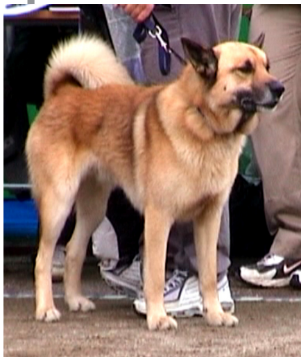
Årsmöte och utställning