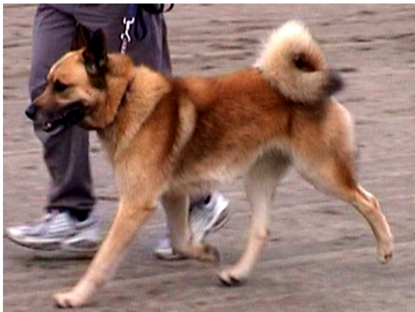
King, BIS för dagen

Årsmötet avslutades med en superb middag på Ansia camping. Därefter begav sig medlemmarna hemåt, vi som hade riktigt långt att åka stannade en natt till innan kosan styrde hemåt.