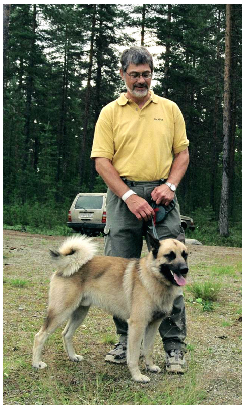
Ordföranden med egen hund

Under eftermiddagens möte presenterades och diskuterades två för klubben viktiga punkter. Den ena punkten berörde förslag till förändringar av klubbens stagar för att möjliggöra en senare anslutning till SÅK. Den andra punkten var en presentation av ett första utkast till avelsstrategi som skall tillställas SÅK. Om klubbens stadgar kan ni läsa på annan plats i tidningen. Avelsstrategin kommer i nästa nummer.