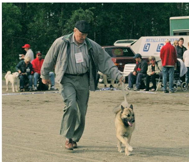
Både Husse och hund får springa i ringen

När man studerar ekipagen i ringen så kan man snabbt konstatera en sak. Ringträning krävs hos flertalet hundägare. Det kan inte vara lätt för domaren att bedöma hundens rörelsemönster när hunden galopperar, skuttar, skäller, drar och gör utfall mot andra hundar då domaren ber föraren springa runt med hunden i trav. De flesta hundarna är nog chockade över att den där personen som kallar sig husse/matte springer bredvid dem. Detta har aldrig hänt förut, vad ska nu ske?