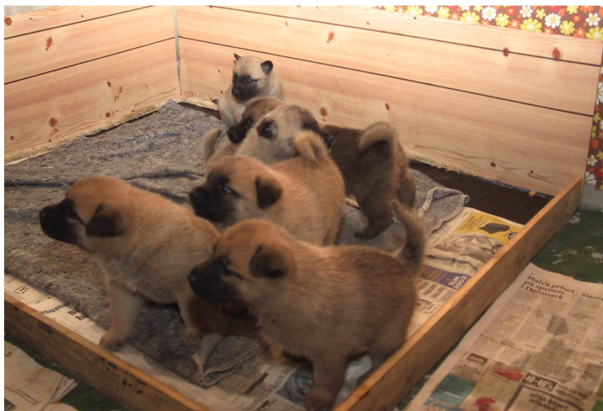
Valpar efter en tik med förstapris i jaktprov

Något vill jag ändå kommentera de resultat som vi hittills har uppnått. Då man försöker bilda sig en uppfattning om den jaktliga kvalitén hos en ras räknas bl a antalet hundar som kommer ut på prov i förhållande till hur många som blivit födda inom rasen under en viss tidsperiod. En vanlig siffra är då