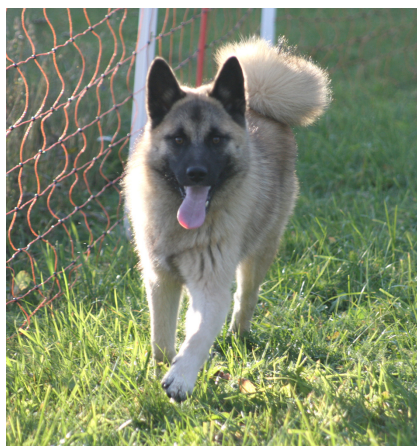
Norma 6 månader, Ulrica Nykvist

Hälleforshundklubben Fälla Gård 265 Norrfors, 905 92 Umeå